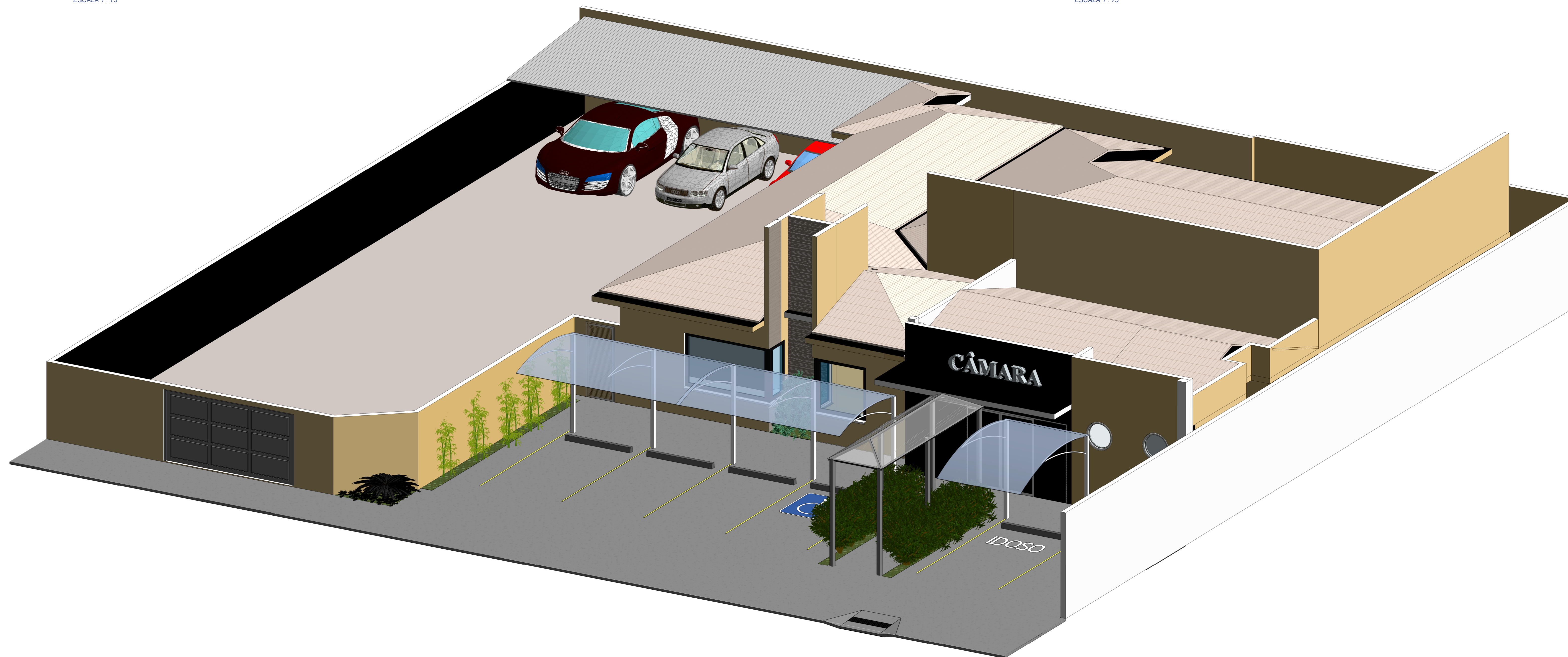
VISTA 3D ESCALA